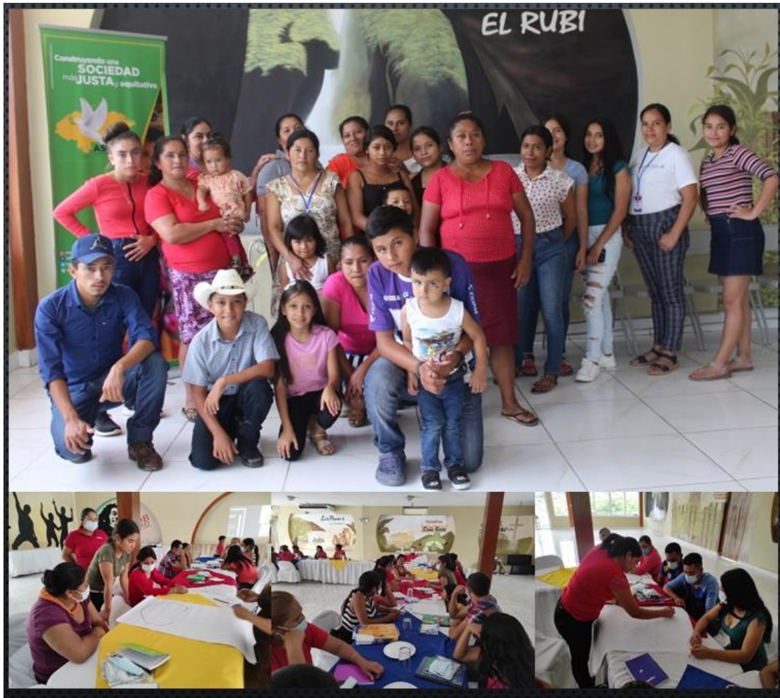
Fotografía: Grupo: Red de Santa Rita, Copán